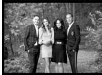
The Vescio Family