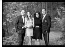
The Vescio Family