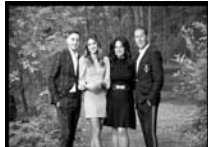
The Vescio Family