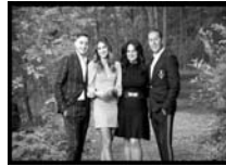
The Vescio Family