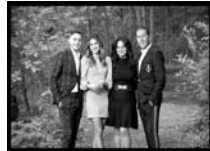
The Vescio Family