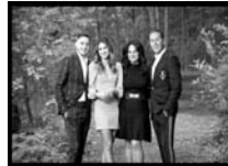
The Vescio Family