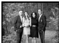
The Vescio Family