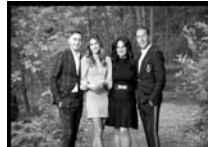
The Vescio Family