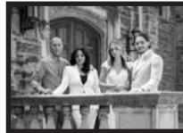
The Vescio Family