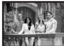
The Vescio Family