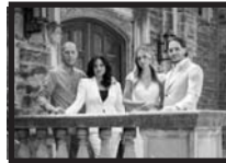
The Vescio Family