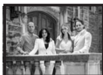
The Vescio Family